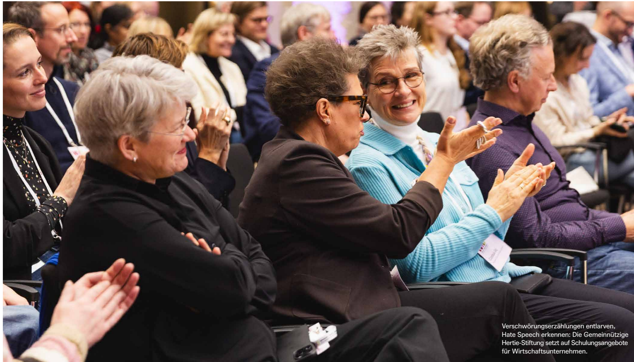
Verschwörungserzählungen entlarven, Hate Speech erkennen: Die Gemeinnützige Hertie-Stiftung setzt auf Schulungsangebote für Wirtschaftsunternehmen.

Demokratie ist eine wichtige Gelingensbedingung für die Wirtschaft. Eine florierende Marktwirtschaft ist auf Meinungsfreiheit und eine offene Gesellschaft mit talentier-